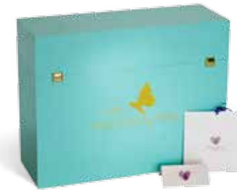
Hochzeitspapeterie Exklusive, eigene Kartenserie der Hochzeitsprofis

Alles begann 2006 mit der Entwicklung unseres 1. Ratgebers, mit dem wir Brautpaaren helfen wollten, ihre Traumhochzeit selbst zu planen. Mittlerweile gibt es davon die 3. Auflage, zahlreiche neue Produkte aus der Hochzeitswelt und seit 2012 die professionelle Ausbildung zum Hochzeitsplaner in Zusammenarbeit mit der IHK Köln.