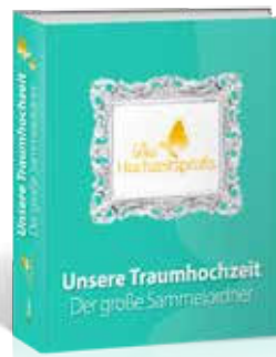
Ordner Der große Sammelordner für Ihre Traumhochzeit