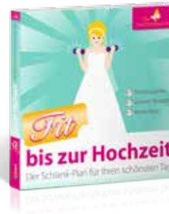
Ratgeber: Fit bis zur Hochzeit