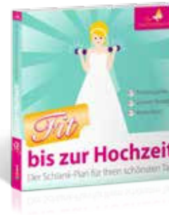
Ratgeber: Fit bis zur Hochzeit