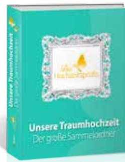
Ordner Der große Sammelordner für Ihre Traumhochzeit