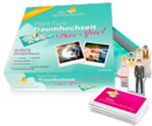
Brettspiel Plant Eure Traumhochzeit