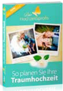
Ratgeber: So planen Sie Ihre Traumhochzeit