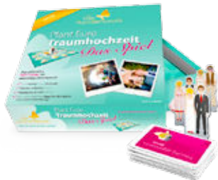
Brettspiel Plant Eure Traumhochzeit