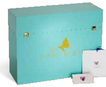
Hochzeitspapeterie Exklusive, eigene Kartenserie der Hochzeitsprofis

Alles begann 2006 mit der Entwicklung unseres 1. Ratgebers, mit dem wir Brautpaaren helfen wollten, ihre Traumhochzeit selbst zu planen. Mittlerweile gibt es davon die 3. Auflage, zahlreiche neue Produkte aus der Hochzeitswelt und seit 2012 die professionelle Ausbildung zum Hochzeitsplaner in Zusammenarbeit mit der IHK Köln.