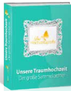
Ordner Der große Sammelordner für Ihre Traumhochzeit