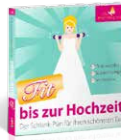
Ratgeber: Fit bis zur Hochzeit