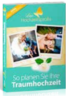
Ratgeber: So planen Sie Ihre Traumhochzeit