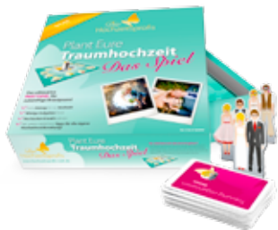
Brettspiel Planen Ihre Traumhochzeit