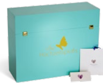
Hochzeitspapeterie Exklusive, eigene Kartenserie der Hochzeitsprofis

Alles begann 2006 mit der Entwicklung unseres 1. Ratgebers, mit dem wir Brautpaaren helfen wollten, ihre Traumhochzeit selbst zu planen. Mittlerweile gibt es davon die 3. Auflage, zahlreiche neue Produkte aus der Hochzeitswelt und seit 2012 die professionelle Ausbildung zum Hochzeitsplaner in Zusammenarbeit mit der IHK Köln.