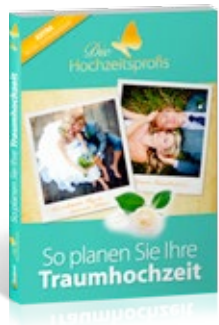
Ratgeber: So planen Sie Ihre Traumhochzeit