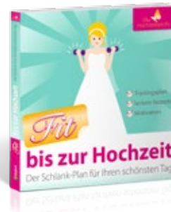
Ratgeber: Fit bis zur Hochzeit