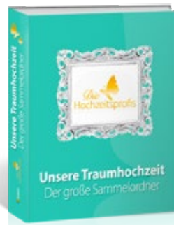
Ordner Der große Sammelordner für Ihre Traumhochzeit